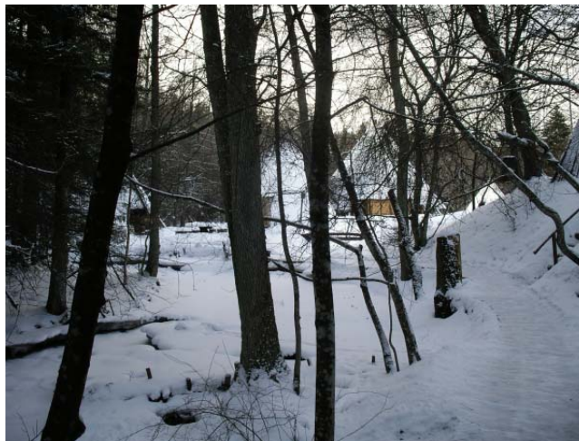
Lahemaa rahvusparki territooriumil, I kategooria kaitsealuse kalaliigi kudemisjõe ääres asub loata püstitatud puhkekeskus.

119. Keskkonnainspeksiooni hinnangul on nende poolt määratav trahvisumma enamasti vahemikus 3000–10 000 krooni, trahvisummade kohtus vaidlustamise korral vähendatakse enamasti summat veelgi. Auditeerimisel tutvus Riigikontroll mitmete juhtumitega, kus isikud olid vaatamata korduvatele juba ehitamise algfaasis kohaldatud sunnirahadele ning trahvidele omavalilised ehitised valmis ehitatud.