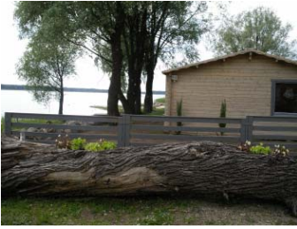
Ilma ehituskeeluvööndit vähendamata Tamula järve ehituskeeluvööndisse omavalitsuse nõusolekul ehitatud hoone.